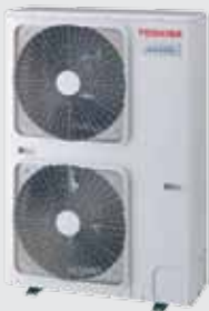
RAV-SP1104AT-E RAV-SP1404AT-E RAV-SP1104AT8-E RAV-SP1404AT8-E RAV-SP1604AT8-E