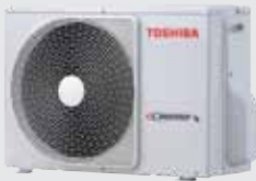
RAV-SP404AT-E RAV-SP454AT-E RAV-SP564AT-E