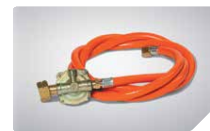
Газовый шланг с редуктором давления 1,5 м