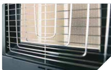
Эксклюзивный дизайн защитной фронтальной решётки из нержавеющей стали