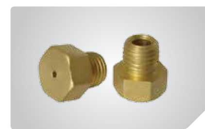
Работает на пропане и метане, обе форсунки в комплекте

Экономичный отопительный прибор BIGH-3 для локального, направленного обогрева