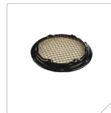
Высококачественная керамическая панель класса А