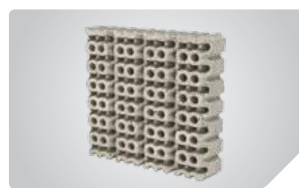
Высококачественная керамическая панель класса А