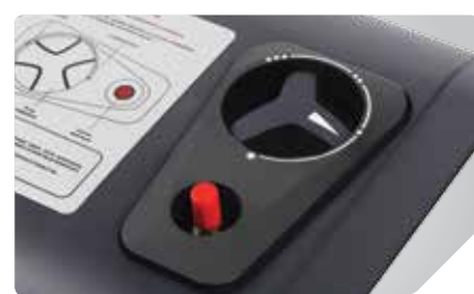
Эргономичная панель управления

Газовые обогреватели серии GALAXY - это новейшая российская разработка для комбинированного обогрева жилых помещений