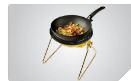
2 в 1: функции обогрева и приготовления пищи