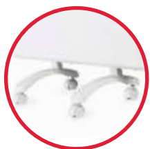
ножки для конвектора