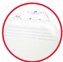
встроенный электронный термостат NCU 1S