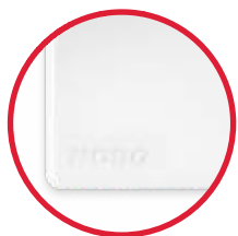
логотип на фронтальной панели