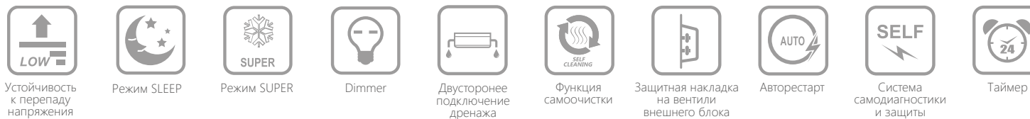
Устойчивость к перепаду напряжения

Функциональное оснащение сплит-систем серии BLACK STAR Classic A включает в себя опцию I Feel (Я ощущаю), которая позволяет контролировать температуру непосредственно рядом с пользователем.