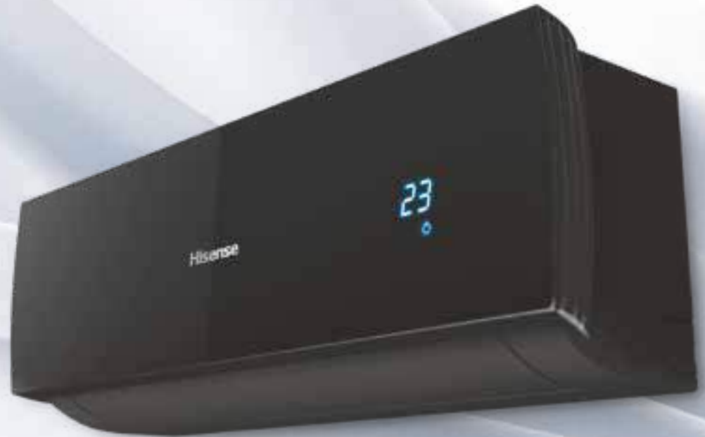
BLACK STAR DC Inverter