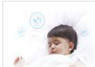
5 скорости вентилятора Низкий уровень шума от 24 дБ(А)