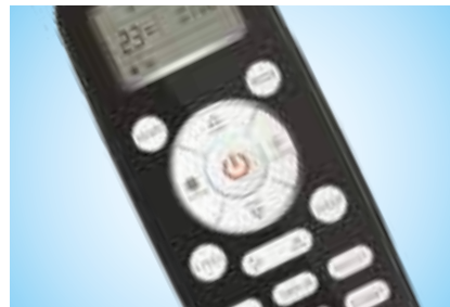
Удобный современный пульт